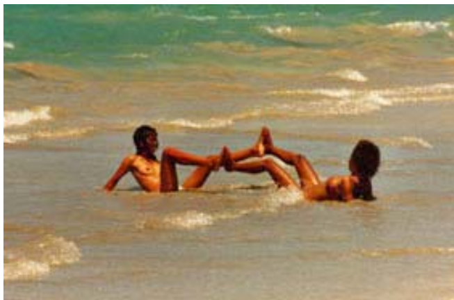
Baden hinter dem Riff gefahrlos möglich

Die Wassertemperatur der Küstengewässer der Westküste ist wesentlich wärmer als diejenige der Ostküste .