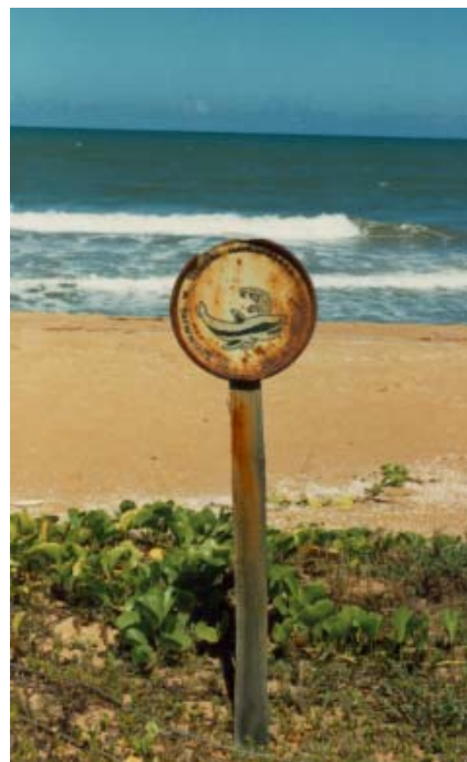
Badeverbote und Haigefahr beachten