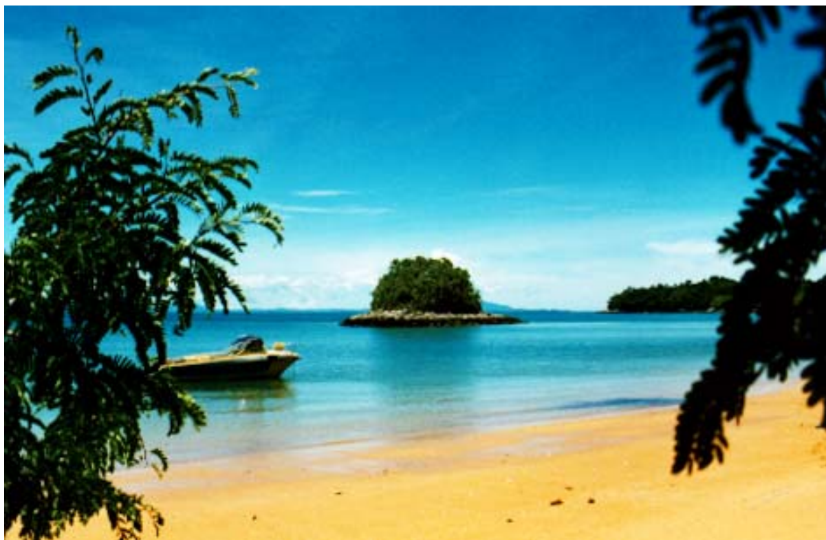
Strand auf der Nebeninsel Nosy Sakatia auf Nosy Be