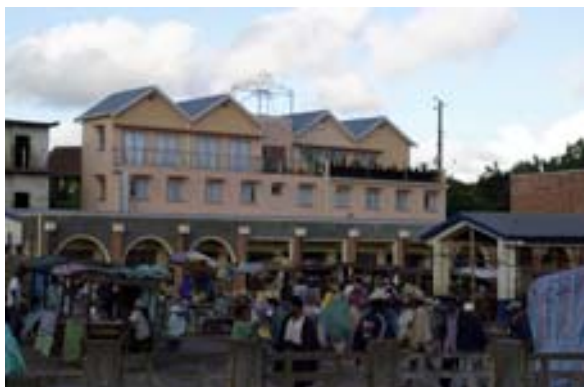
Prisme Hotel beim Markt