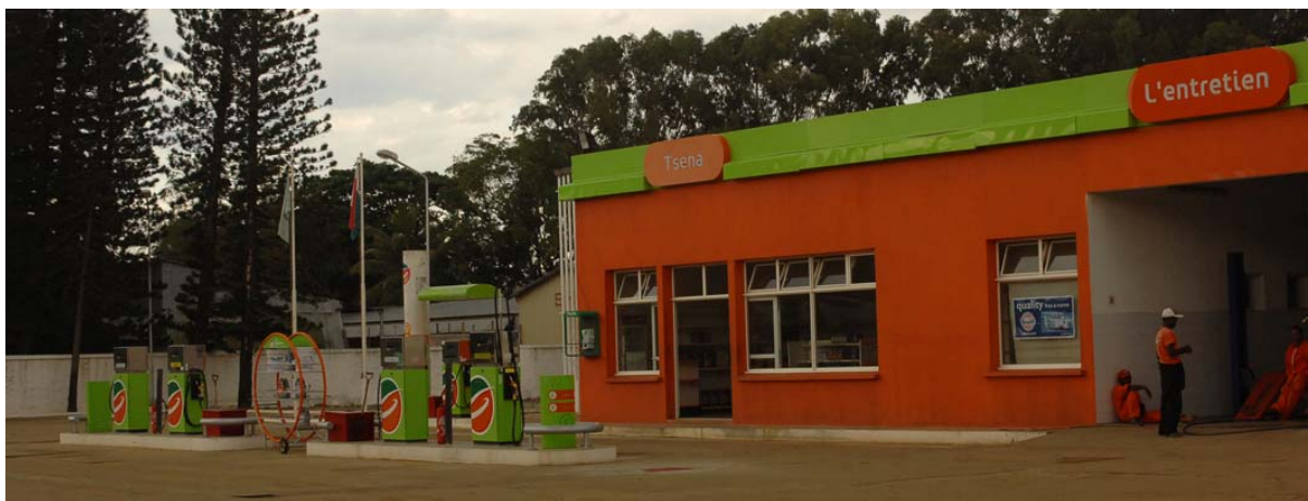
...neu eröffnete in Fort-Dauphin