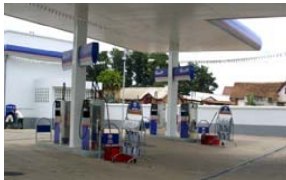
Moderne Tankstelle in Talatamaty bei Tana

Auf den Fahrzeugen der DILAG-TOURS wird immer ein Reservekanister mit mindestens 30 Litern Diesel mitgeführt.