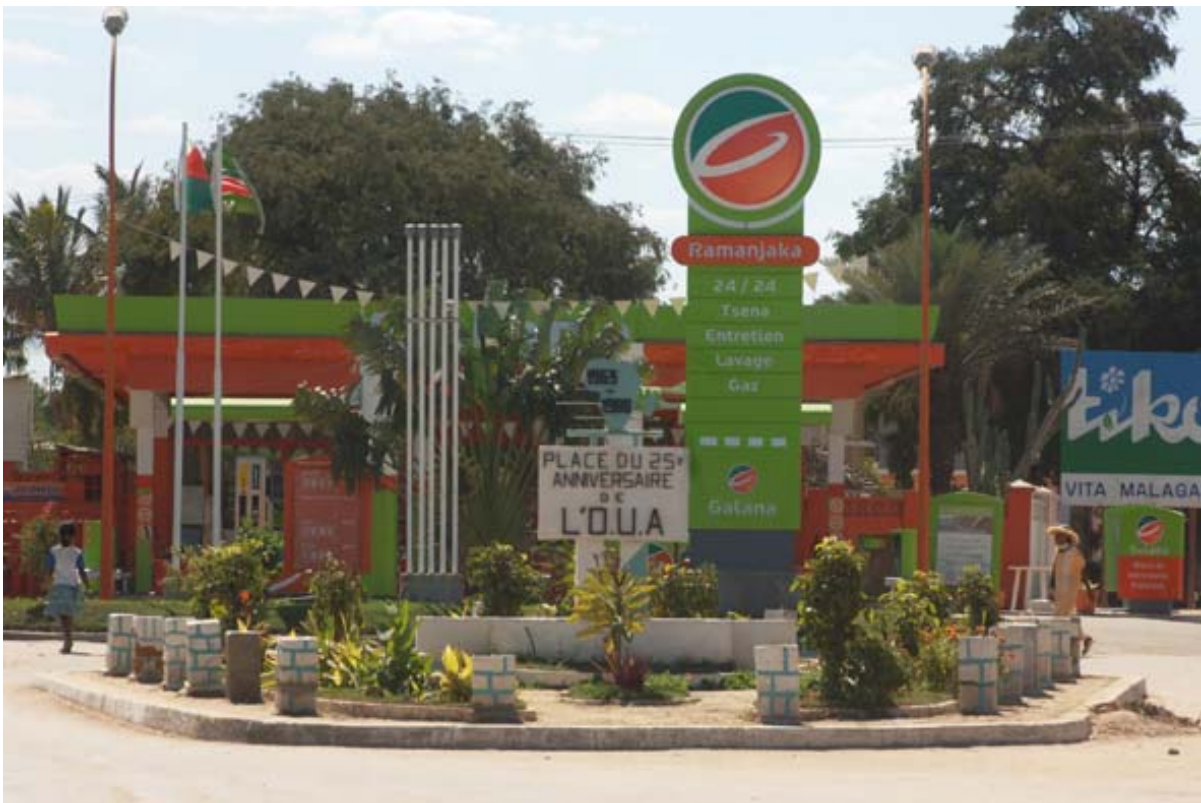
Moderne, neue Tankstelle in Tuléar