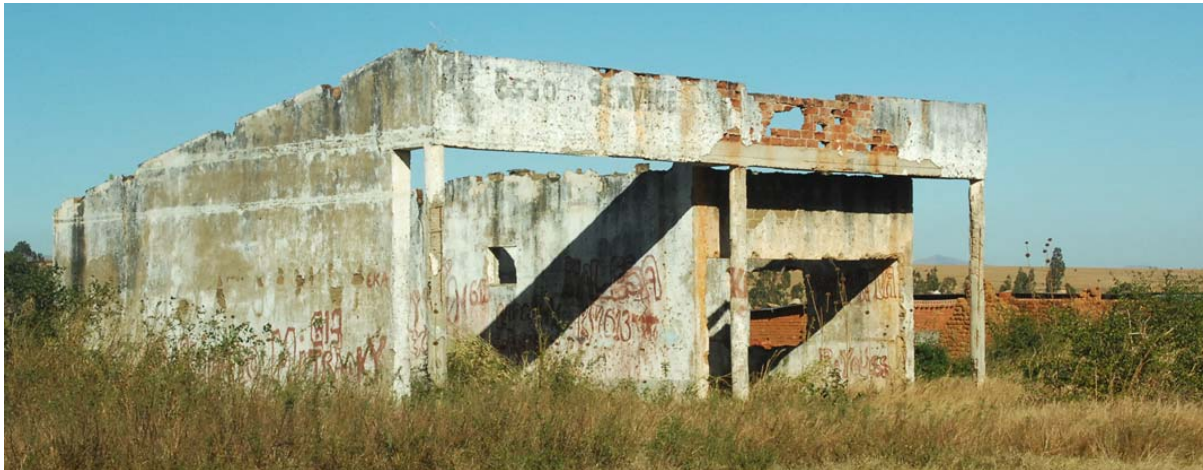
Ruine einer alten Shell-Tankstelle in Betroka und...