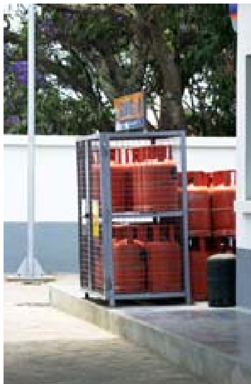
Tankstelle mit Handpumpe in Maevatanana