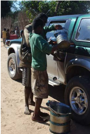
Literweise in Bezaha oder...