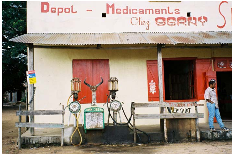
...Handpumpen in Gefäße mit fünf Litern in Ranohira