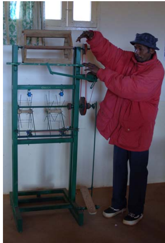
Einfache Einrichtungen im Seidenraupen -Institut

► Siehe auch unter „ Arbeiten “, unter „ Autofahren “, unter „ Denkmäler “, unter „ Früchte “, unter „ Gebirge “ – Pic Boby, unter „ Geographie “ – Hochland , Süden , unter „ Glossar “ – Ambalavao, unter „ Hotels “ – Liste der Hotels / Ambalavao , unter „ Hotelliste “ – Ambalavao, unter „ Kunst und Kultur “ – Büttenpapier, unter „ Naturschutzpärke “ – Andringitra , Privatpärke , unter „ Orte-Info-Blätter “ – Ambalavao , unter „ Postleitzahlen “, unter „ Reiserouten “ – Grosse Süd-Tour , Kleine Süd-Tour , Grosse West-Tour , Erlebnis-Süd-Tour , Süd-Nord-Tour und Naturschutzpark-Tour , unter „ Souvenirs “ – Büttenpapier , Lamba Oany , Seide und Textilien , unter „ Sportaktivitäten “ – Klettern , Wandern , unter „ Touristik-Karten “ – Hochland , Süden und unter „ Vegetationszonen “.