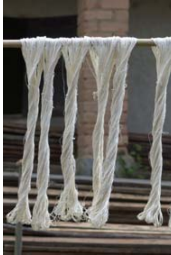
Weisses Garn für die Lamba