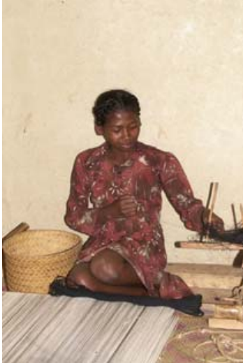
Junge Frau beim Weben eines Lamba Mena