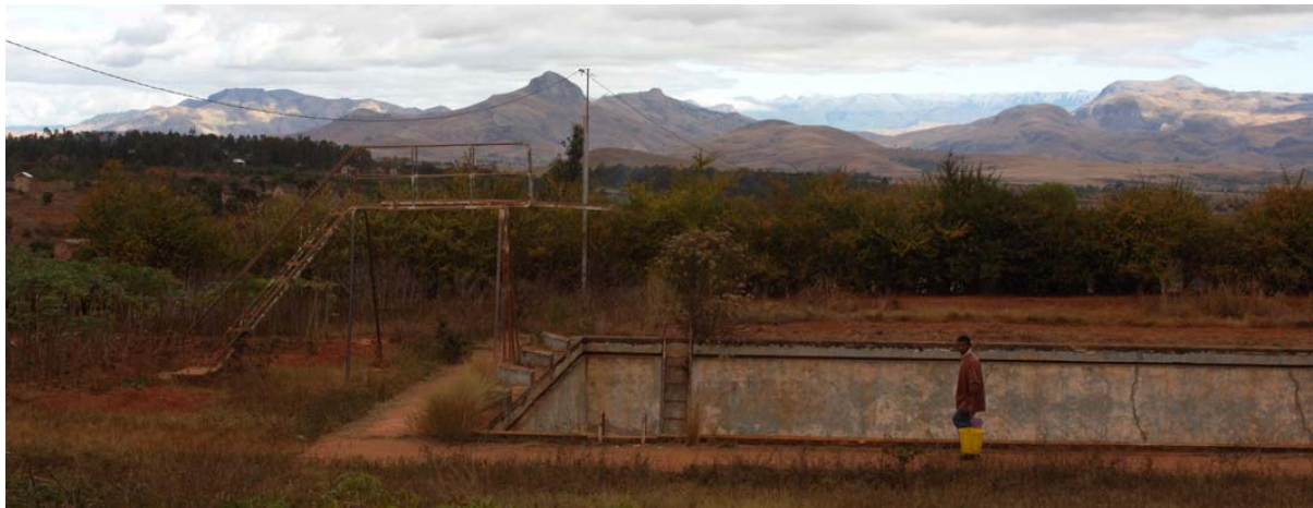
Ein völlig verlottertes Schwimmbecken hinter dem Markt