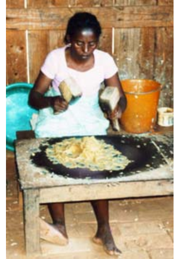
Klopfen des Rohmaterials für das Papier der Antaimoro