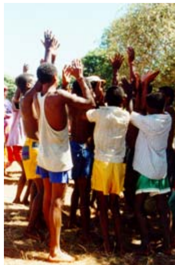
...und Tanz locken...