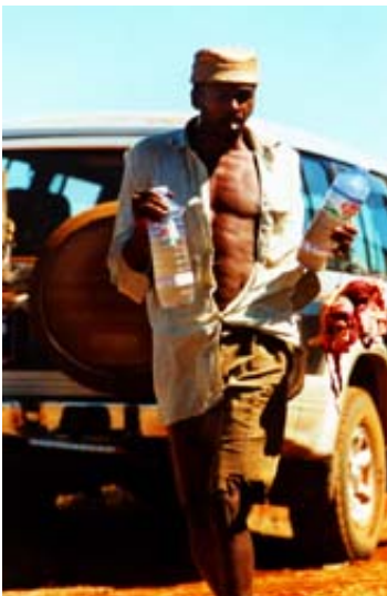
Fleisch, Rum, Gesang...