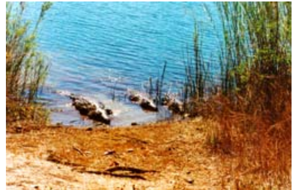
...die Krokodile leben