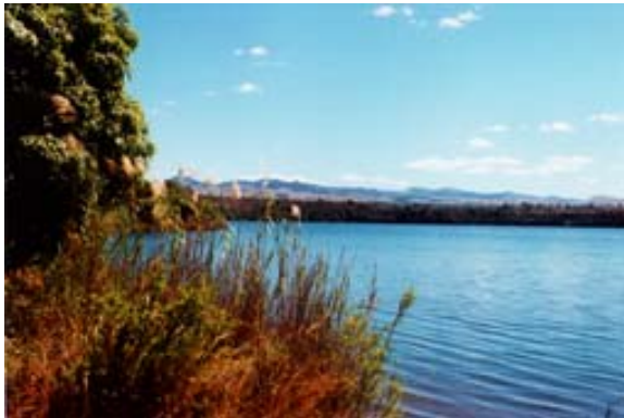
Heiliger See östlich der Ortschaft in dem...

Die Einwohner von Anivorano-Nord opfern den Krokodilen regelmässig Zebus, deren Fleisch sie an einer Stelle am See auslegen. Die Krokodile kommen dann, um das Fleisch zu fressen. Wenn man die Bewohner am See bittet, ihnen das Fleisch beschafft und genügend Rum zum Trinken gibt, tanzen und singen sie an der Opferstelle . Es kann bis zu drei Stunden dauern bis die Krokodile durch den Gesang angelockt werden und das Fleisch fressen kommen. Eine eindrückliche Zeremonie . Die Krokodile sind sehr gross und man kann sie auf einige Meter Entfernung beim Fressen beobachten.