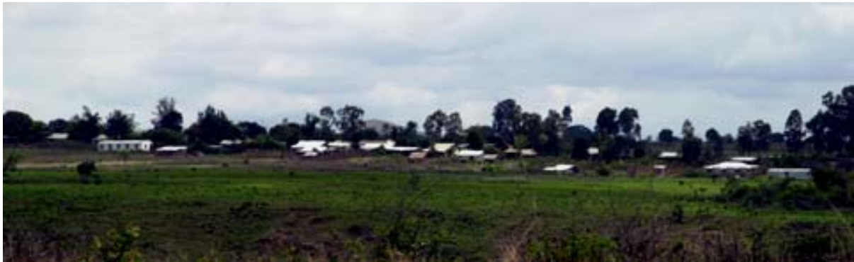
Ortschaft von der Piste nach Ankarana West her

Ein paar hundert Meter in südlicher Richtung auf der RN 6 zweigt rechts die Piste zum Eingang des Parks Ankarana West ab. Die Piste kann nur während der Trockenzeit befahren werden und für die 28 Kilometer bis zum Campingplatz im Park muss mit einer Fahrzeit von 2 ½ Stunden gerechnet werden.