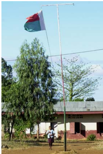
Typische Landschule ,...