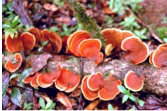
Ast voller Pilze