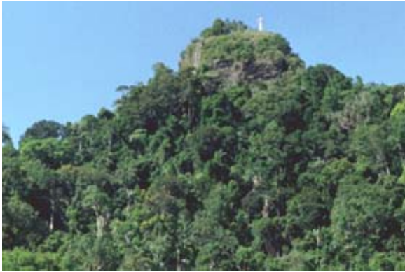
Kreuz auf Berg im Regenwald unterhalb von Ranomafana