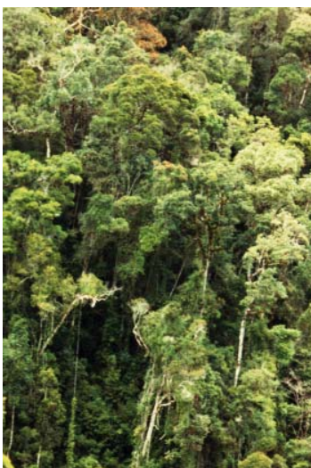
Hochstämmiger Regenwald bei Ranomafana