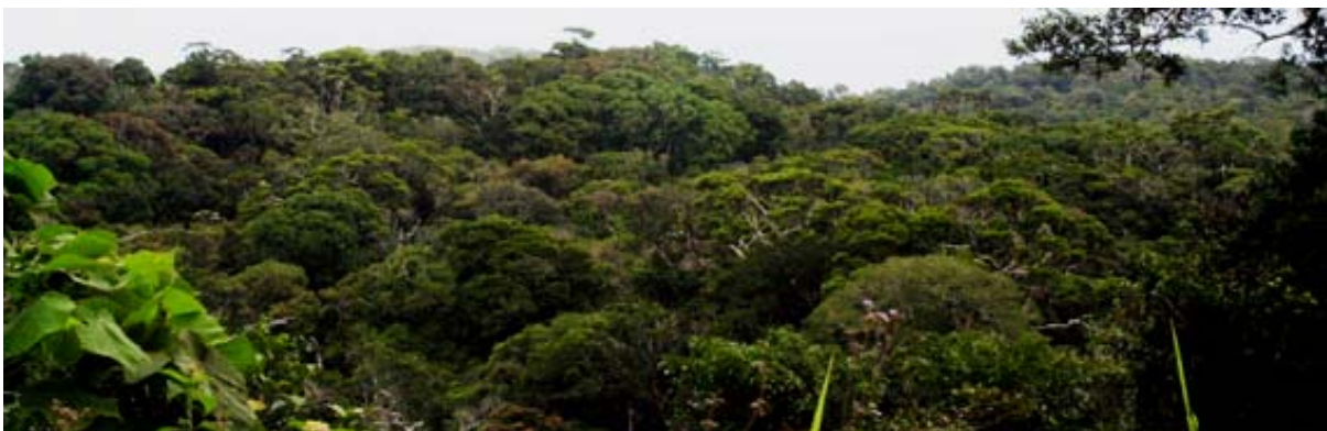
Nebelregenwald im Forêt d'Ambre