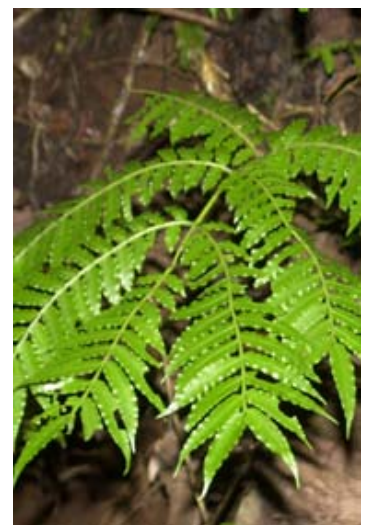
Kleiner Farn im Forêt d'Ambre