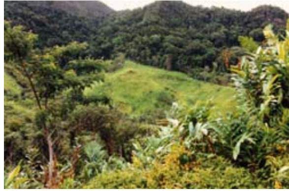
Regenwald mit gerodeten Stellen