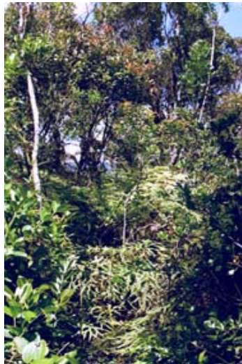
Dickicht im „Dschungel“ bei Ranomafana