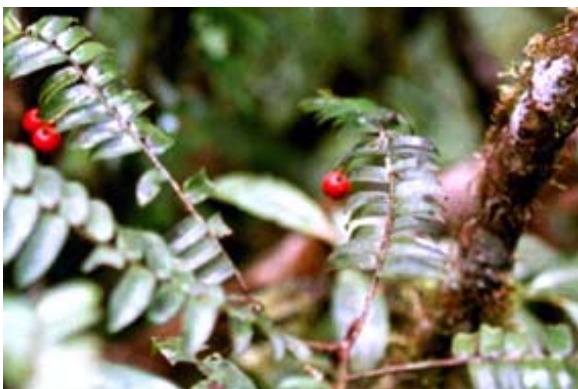
Ongestanium mit Früchten und...