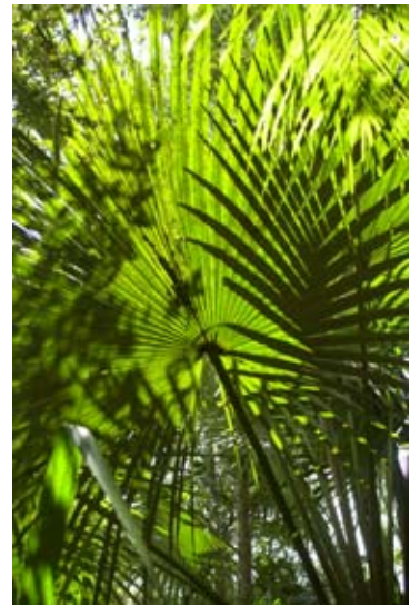
Blatt einer Shatanpalme in Tampo bei Masoala