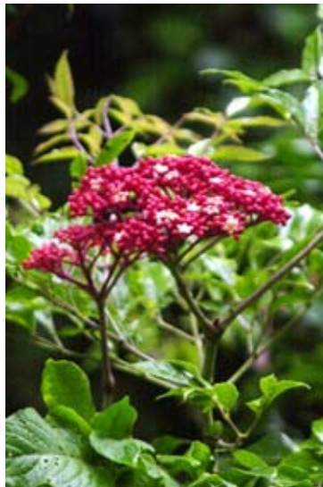
...Blüten im Forêt d'Ambre