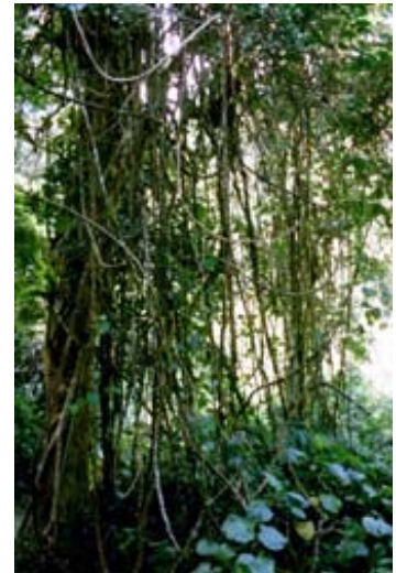
Lianen im Nebelregenwald des Parks „ Forêt d’Ambre “