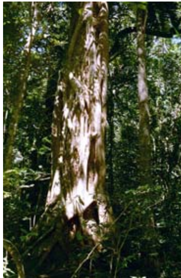
Würgefeige an Stamm im Forêt d'Ambre