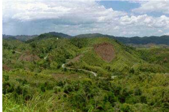
RN 25 von Fianarantsoa nach Manakara durch den abgeholzten Regenwald