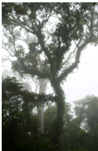
Nebelregenwald im Forêt d'Ambre an einem Regentag