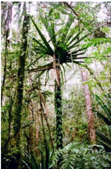
Pandanus (Schraubenpalme) in Périnet