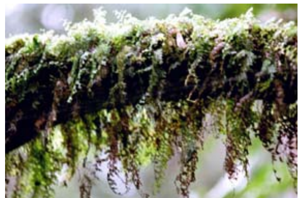
...Ast mit viel Moos in Périnet

Der zoologische Garten in Zürich wurde im Jahre 2003 die Masoala-Regenwald-Halle eröffnet, – siehe auch unter www.masoala.ch , in welcher ein kleiner Teil der Flora und Fauna dieses Gebietes besichtigt werden kann.