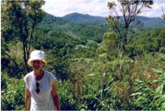
Mitverfasserin im Regenwald bei Ranomafana