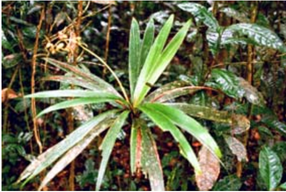
Dypsipaltes louveliis Palme in Périnet