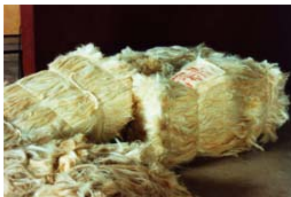
...Roh-Sisal für dem Export