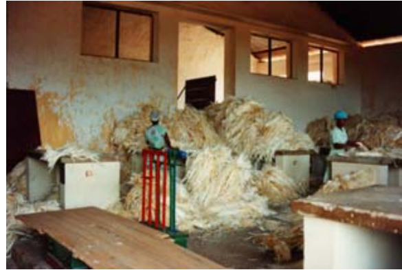
Lagerhalle der Sisalfasern