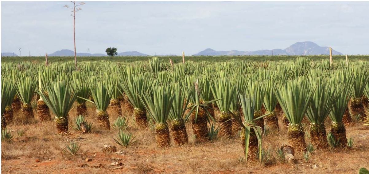
Sisal-Plantagen bei Amboasary

Die Blattfasern können zu zahlreichen Produkten verarbeitet werden wie Bauplatten, Seile, Polstermatten, Papier usw. Mit dem Export der Sisalfasern löst Madagaskar einen beachtlichen Anteil an Devisen.