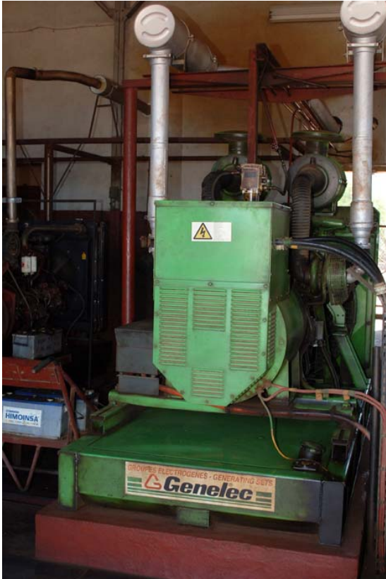
Mehrere Generatoren produzieren Strom