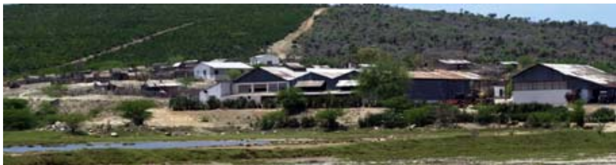
Sisal-Fabrikanlage beim Lac Anony