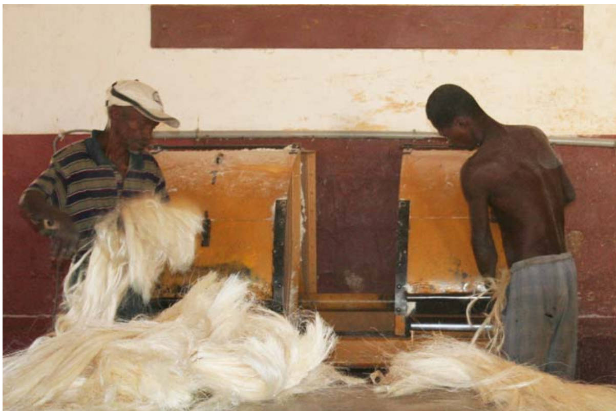
Von Hand werden die Bündel der Fasern maschinell gebürstet