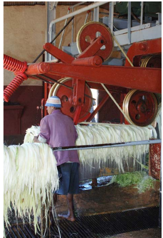
... dem Berenty-Park und Output der Maschine