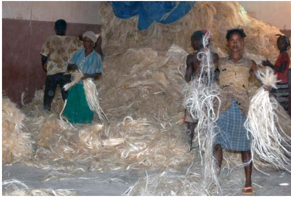
Sortieren der Fasern