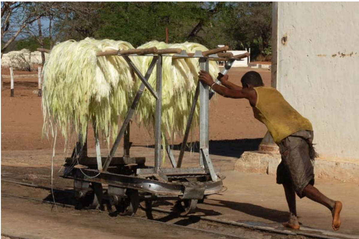
Frisch verarbeiteter Sisal wird zum Trocken weggekart