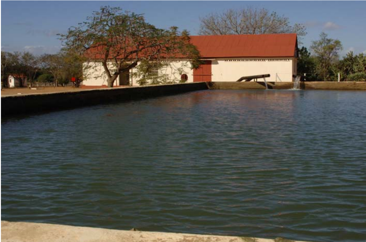
Für die Verarbeitung ist viel Wasser notwendig – Frischwasser-Bassin