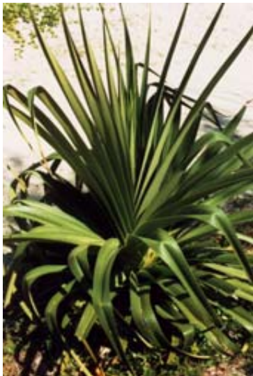
Wilder Sisal und...