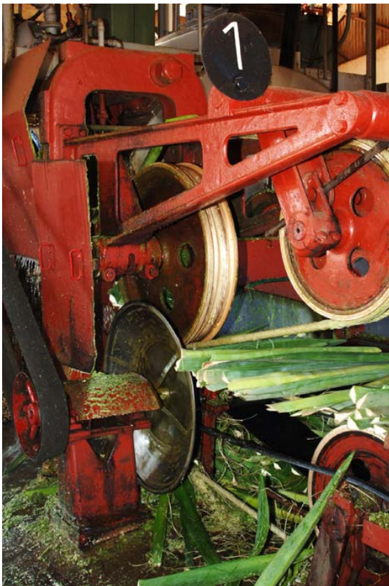
Maschinelle Verarbeitung in der Fabrik hinter ...