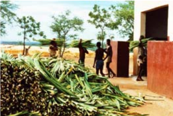
Arbeiter bringen den Sisal in die Fabrik...