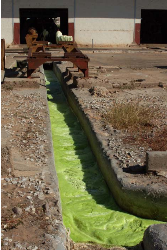
Abwasser mit organischen Stoffen als Dünger