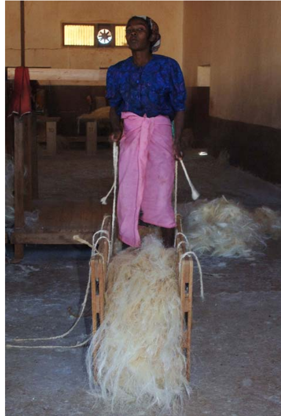
Stampfen der Fasern für den Versand