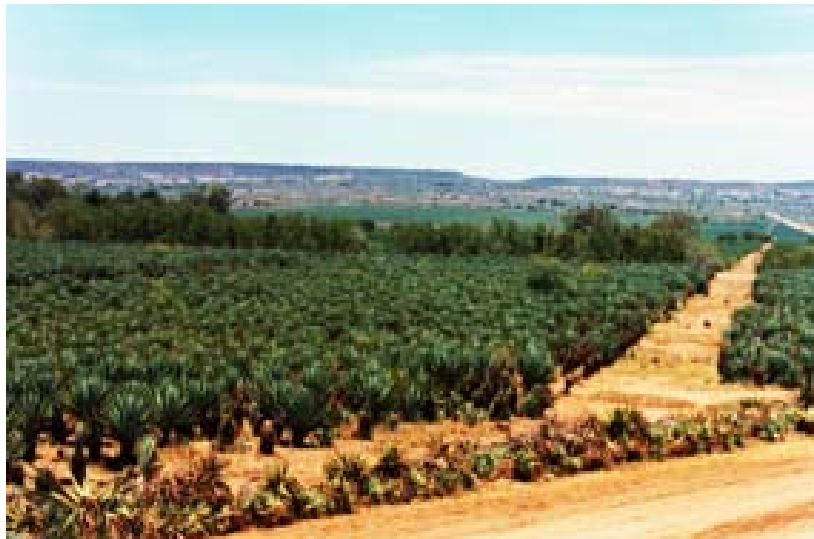
...Sisal-Plantagen im Becken von Amboasary

▶ Siehe auch unter „ Bevölkerung “ – Antanosy, unter „ Eckdaten des Landes “, unter „ Geographie “ – Süden , unter „ Landwirtschaft “, unter „ Orte-Info-Blätter “ – Fort-Dauphin , unter „ Ortschaften “ – Amboasary , Tolanaro , unter „ Pflanzen “ – Sukkulente , unter „ Reiserouten “ – Grosse Süd-Tour , Kleine Süd-Tour , Süd-Nord-Tour , Erlebnis-Süd-Tour sowie Zusatzprogramm Fort-Dauphin , unter „ Naturschutzpärke “ – Berenty-Park , unter „ Touristik-Karten “ – Süden und unter „ Wirtschaft “ – Symbol auf der Karte.