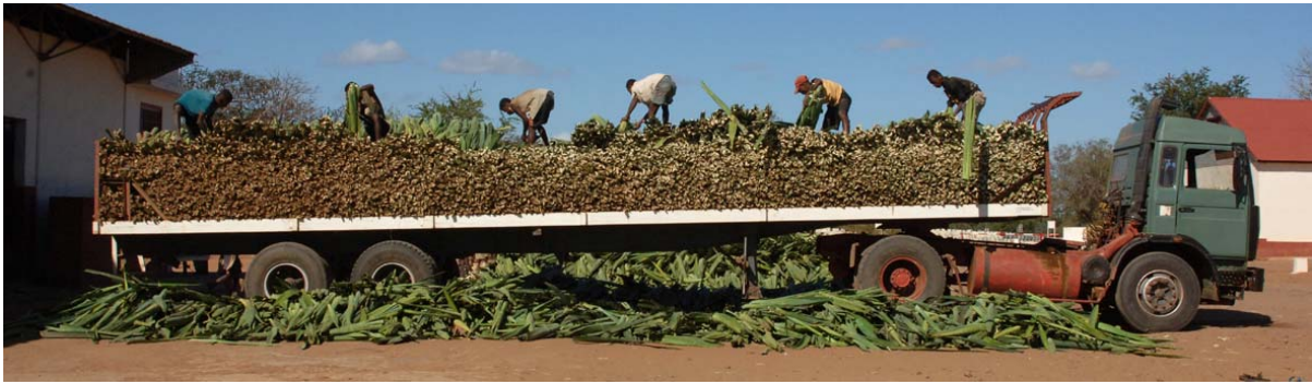
Anlieferung von frischem Material