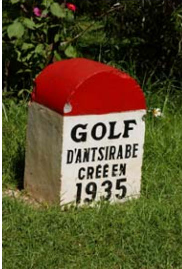
Grenzstein am Eingang

Der Golfplatz des Clubs in Antsirabe wurde 1935 gegründet und umfasst nur etwas mehr als 30 Mitglieder. Die Greens bestehen aus Sandflächen. Der Platz befindet sich westlich der Stadt am Fusse des Mont Ivohitra . Man erreicht ihn indem man beim Kreisel an der Strasse nach Miandrivazo, wo die RN 35 stark abfällt, die Strasse halblinks nimmt und bis an deren Ende fährt. Dann nach rechts bis zum Ende der gepflasterten und nach ein paar Metern folgt man der Piste nach links. Die Telefonnummer lautet: 032 07 045 07