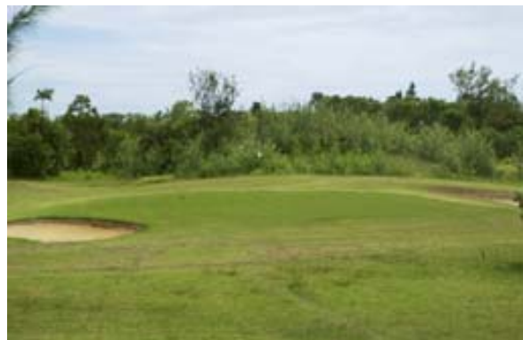
...Green mit Büschen

Gemäss den am Klubhaus aufgehängten Listen des Vorstandes und der Mitglieder umfasst der Club nur 19 Mitglieder, 3 Kinder und ein paar affilierte Mitglieder. Es fällt auch, dass auch zwei Namen deutscher Herkunft erscheinen. Weitere Infos: http://www.3dmadagascar.com/salon800/page2d.asp?CAT=-1&STAND=1317&PROC=3&PAGE=1446