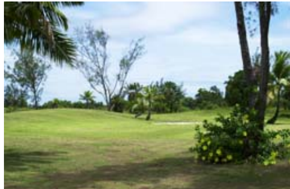
...Bunker mit Alamandas,...