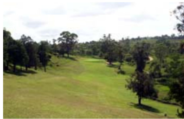
...Greens an Hängen,...