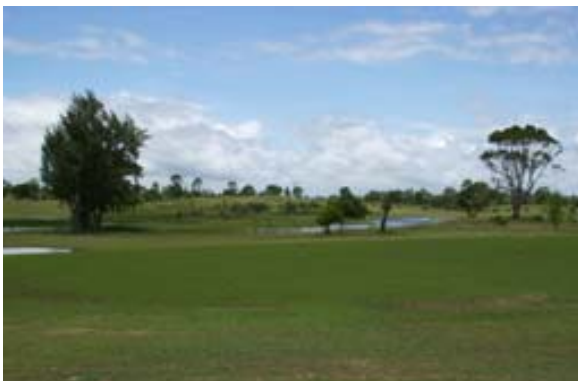
...Weihern als Hindernisse und...