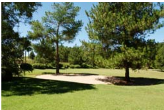
..aus Sand und...