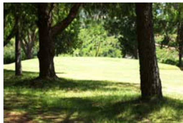
...ausserhalb der Hauptstadt

Was ist neu Inhaltsverzeichnis Stichwortverzeichnis