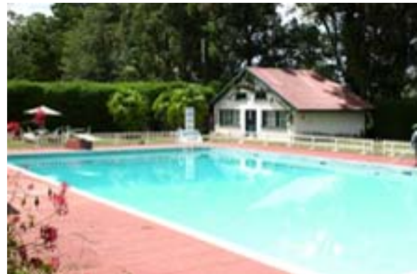
... Swimming-Pool ,...