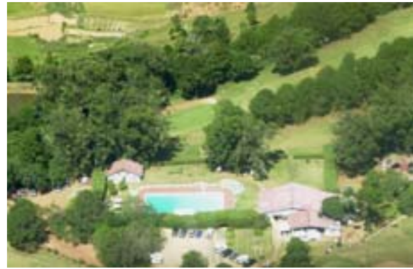
Golfanlage „Golf du Rova“ aus dem Flugzeug.