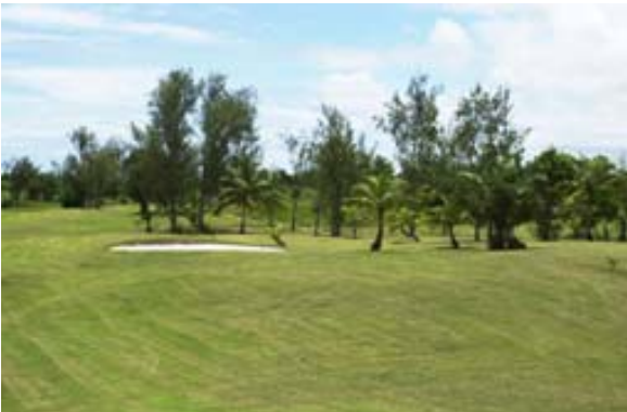
...Bäumen und Palmen...,