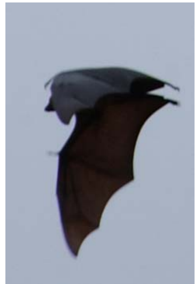
An den Bäumen hängend und im Flug im Berenty-Park