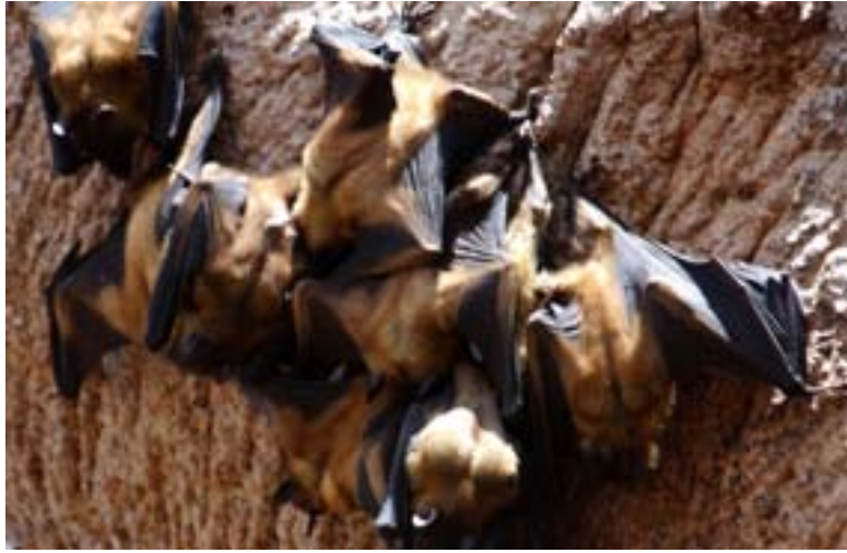
... Welt grössten Affenbrotbaum bei Ampanihy