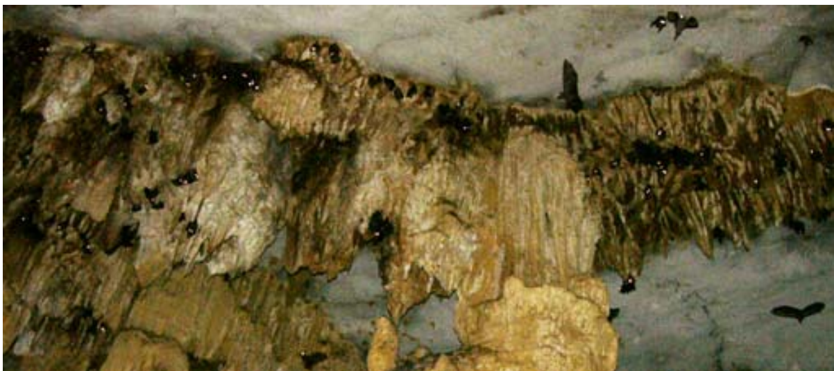
Fledermäuse in den Grotten im Spezial-Reservat von Ankarana