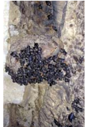
... im Park von Ankarana ,...