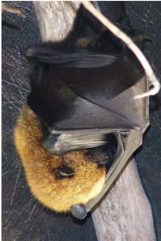
Rufus in der Sammlung Peyrieras