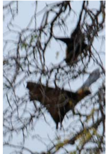
...vor dem Aufsetzen