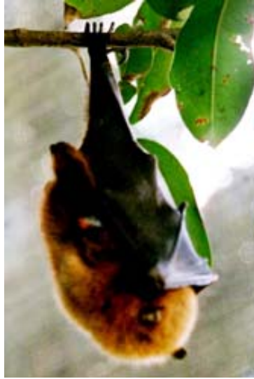
Flughund Hieropus rufus ...