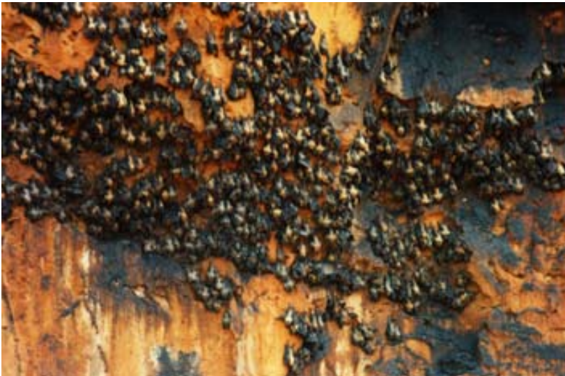
Fledermäuse in der Schlucht des Tsiribihina , in der Grotte ...

Diese beiden Tiere sind die einzigen den Europäern einigermaßen bekannten Säugetiergruppen . Die Flughunde sind reine Fruchtfresser . Sie verfügen auch über kein Ultraschall-Ortungssystem. Sie gleichen diesen Nachteil durch ein wesentlich besseres Sehvermögen aus. Auf Tanikely hängen die Flughunde tagsüber an den Bäumen und können gut fotografiert werden. Auch im Sammlung Peyrieras sind Flughunde vorhanden.