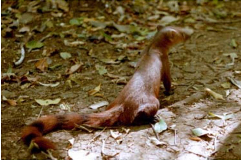
Ringelschwanz-Mungo im Forêt d'Ambre und...

In den Naturschutzparks des Nordens haben sich die Tiere leider schon sehr stark an die Besucher gewöhnt. An den Ess- und Campingplätzen kommen die neugierigen Tiere nahe heran um sich etwas Fressbares zu schnappen. Die hat den Vorteil, dass man sie zu Gesicht bekommt.