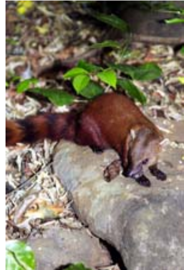
...in Ankarana Ost